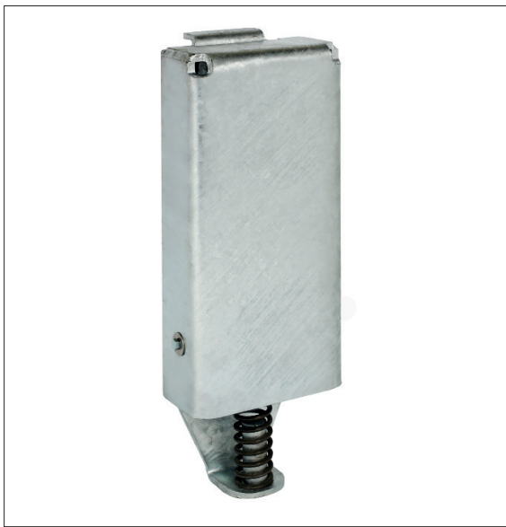
93.950.880 Butoir de quai mobile Poids : 70 Kg la paire.