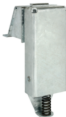
93.950.887 Butoir de quai mobile avec rehausse de 200 mm Poids : 85 Kg la paire.