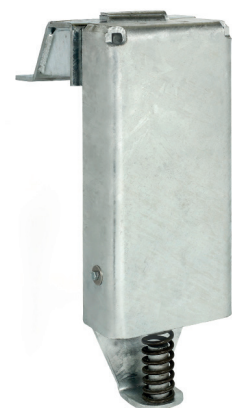
93.950.888 Butoir de quai mobile avec rehausse de 100 mm Poids : 80 Kg la paire.