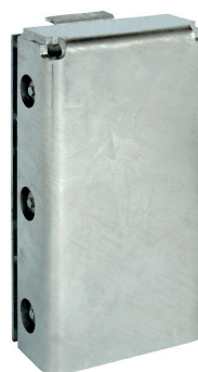
93.950.856 Butoir H = 470 mm.