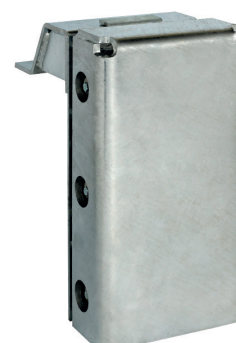
93.950.858 Butoir avec réhausse H = 100 mm.