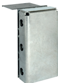
93.950.859 Butoir avec platine rallongée.