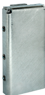
93.950.756 Butoir H = 470 mm.