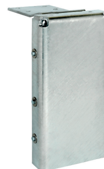
93.950.759 Butoir avec platine rallongée.