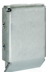
93.950.755 Butoir H = 350 mm.