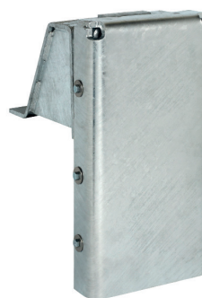
93.950.757 Butoir avec réhausse H = 200 mm.